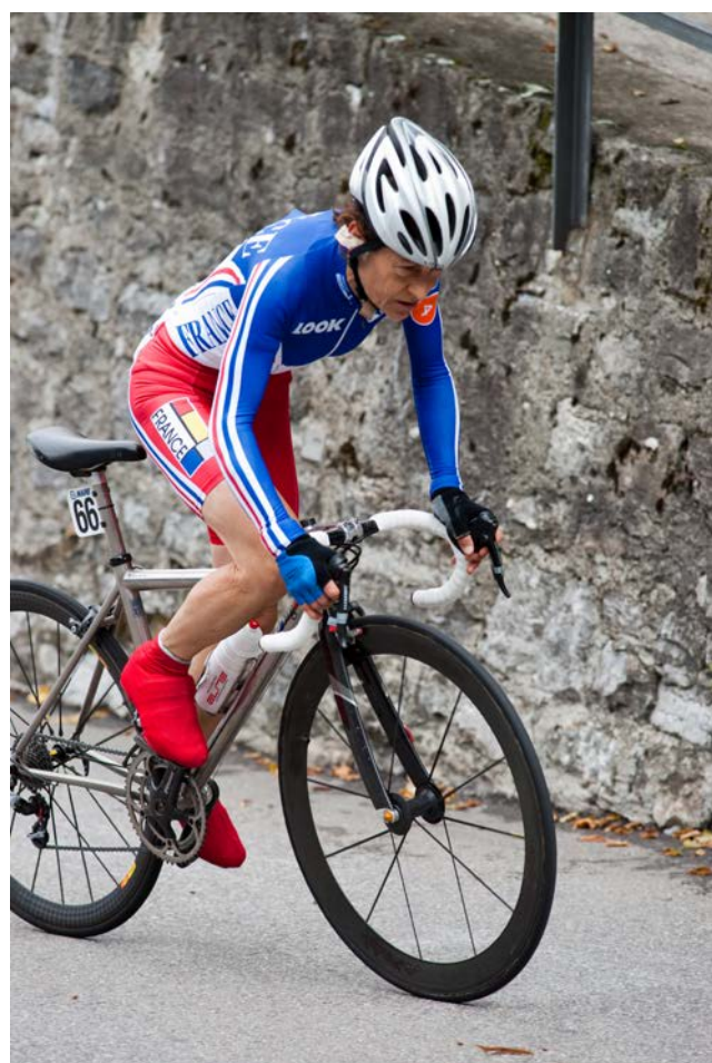
Le rugby féminin La danse masculine Le cyclisme